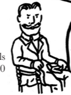
Roberto Michels 1910

Dans l'économie capitaliste l'échange domine la production; il exige, pour que puisse vivre l'entreprise, une exploitation impitoyable de la force de travail. Cela se traduit par la nécessité d'intensifier le travail, d'en raccourcir ou d'en prolonger la durée selon la conjoncture, d'embaucher ou de licencier la force de travail selon les besoins du marché, en un mot de pratiquer toutes méthodes bien connues qui permettent à une entreprise capitaliste de soutenir la concurrence des autres entreprises. D'où, pour la coopérative de production, la nécessité, contradictoire pour les ouvriers, de se gouverner eux-mêmes avec toute l'autorité absolue nécessaire et de jouer vis-à-vis d'eux-mêmes le rôle d'entrepreneurs capitalistes.