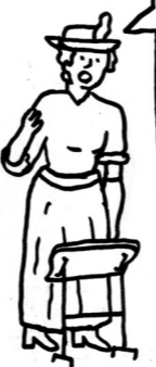
Rosa Luxemburg 1898

L'ESS SE HEURTE À L'ACTION DE L'ÉTAT ET AU CAPITALISME.